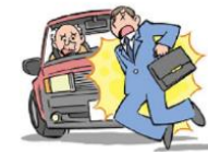
警視庁交通総務課統計